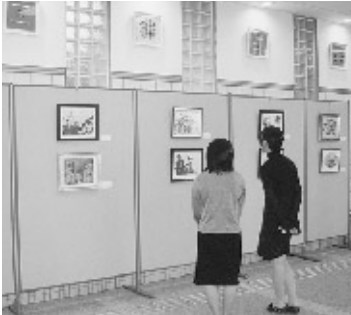
女性に人気の押花展

グループ華展11月16日~30日 美しい色の組み合わせによるパッチワークやフランス刺繍十八点ギャラリーを彩りました。