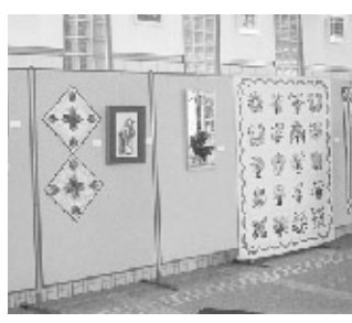
パッチワークにフランス刺繍のグループ華展

分身を落ち葉で作りました。GT敷地内のアメリカカ楓やもみじも使われ、思い思いのポーズをカラフルにデザインし見事な作品に仕上げました。