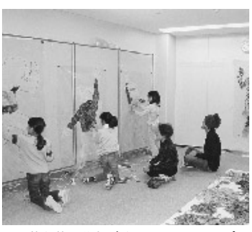
落ち葉で分身づくりワークショップ

分身を落ち葉で作りました。GT敷地内のアメリカカ楓やもみじも使われ、思い思いのポーズをカラフルにデザインし見事な作品に仕上げました。