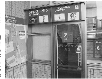
テラス棟2階への入口を自動扉に改善

中目黒GTは間もなく三周年を迎えますが、未だ施設のありかや入口が分かりにくいといった声が聞かれますので、このほど、総合サインの追加や個別サインの改善・整備を図りました。