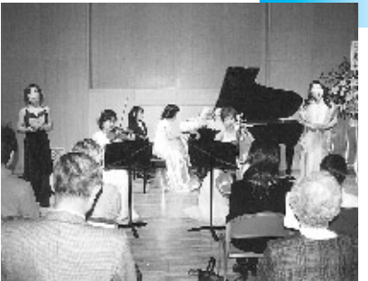
アマー・ピレ・ピアノトリオのソプラノの共演

昨秋十月二十六日、GTプラザホールにおいてアマー・ピレ・ピアノトリオによるコンサートが開かれました。