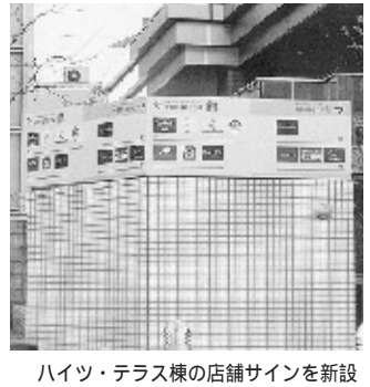
ハイツ・テラス棟の店舗サインを新設

中目黒GTは間もなく三周年を迎えますが、未だ施設のありかや入口が分かりにくいといった声が聞かれますので、このほど、総合サインの追加や個別サインの改善・整備を図りました。