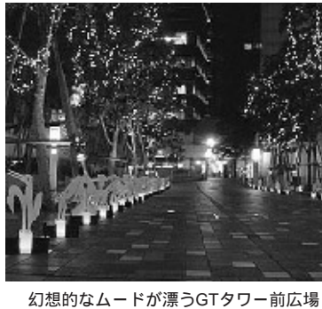
幻想的なムードが漂うGTタワー前広場

イルミネーションでGTをファッションナブルに! 中目黒GTでは、この冬よそとはひと味違ったイルミネーションで皆さんの目を楽しませていきます。 特に、昨年来の十二月十日から二十五日まで、「古代の行列 中目黒」と題する光のイベントを実施し、大きな話題を呼びました。