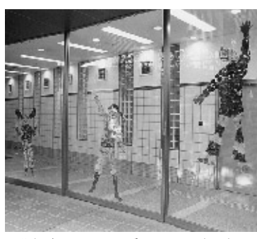
分身がエントランスギャラリーで生き生きと