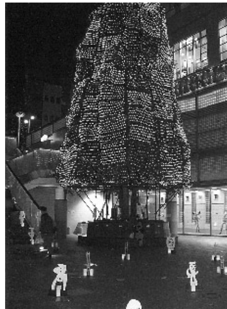
可愛い妖精達と電飾されたシンボルツリー

グループ華展11月16日~30日 美しい色の組み合わせによるパッチワークやフランス刺繍十八点ギャラリーを彩りました。