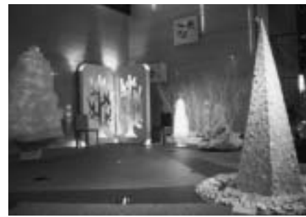
昨年のクリスマスツリーの展示風景

タワー棟前の樹木 シマトネリコの根の先の部分に水と栄養が行き渡るよう養生しています。見守って下さい。