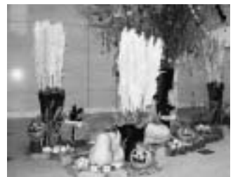
ハロウィンらしい楽しくおしゃれな装飾

タワー棟のロビーには、季節ごとの装飾を施してきていますが、今年はハロウィンをテーマに、思い切って趣向してみました。