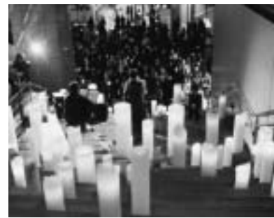
キャンドルの中でアコースティックギターコンサート(昨年12月22日)

中目黒GTでは、今年も楽しい冬を演出します。お揃いでお出かけください。1、「私のクリスマスツリー」を募集