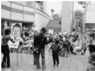
オーバーアクションで素早く特徴をとらえ描く