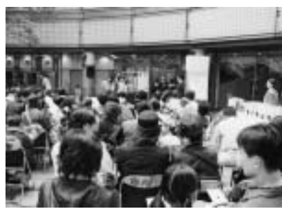
家族で、ペアーでピンゴゲームを楽しむ

オータム フェスティバル 大勢の人出で賑わう 曇り空の下であったが、GTプラザ商店会主催のビッグイベント、オータムフェスティバルが、去る十月十四日、GT広場において開かれました。 人気のピンゴゲームは、プレイヤー、輪投げなどで大いに賑わいました。