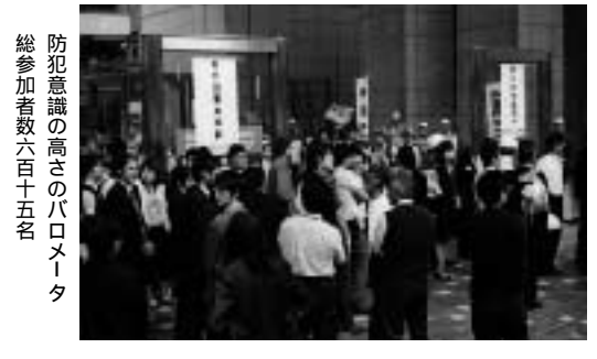
防火意識の高さのバロメータ 総参加者数六百十五名

AED取扱い訓練も熱心に! 全館避難訓練の一環として、プラザホールを会場にAED取扱い訓練を行いました。目黒消防署員に指導を仰ぐ皆様の目は真剣で、かつ生き生きと取り組まれる方々に、当ビル管理スタッフ一同心強いお味方を得た気持ちとなりました。誠にありがとうございました。