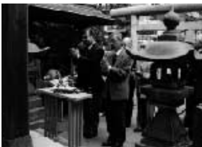
台風第2号接近、寒い！ プルプル第六天社

崇敬会の皆さんにより無事例祭が執り行われました。終了後、別室で二十年度の崇敬会総会が開催されました。次の例祭は、九月十四日です。なお、崇敬会有志の皆様により毎月一日と十五日の朝九時から境内の清掃が行われています。ご都合のつく方は、どうぞご参加ください。