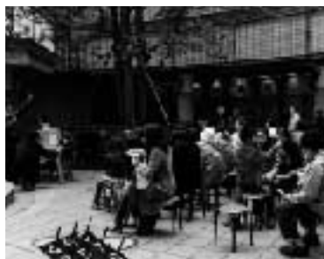
くすの木まつりビンゴゲーム