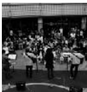
GT春まつりの賑わい