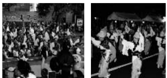
よさこい 阿波おどり (上記写真は昨年のもので)

今年も八月二日(土)、三日(日)の二日間、中目黒が熱くなります! 会場は、メインとなる中目黒銀座商店街通り、西銀座商店街通り、そして中目黒GT・GT交通広場前です。 「流し踊り・組踊り・乱舞(どっこいしょ)・旗の競演」等々、楽しい賑わいとして城南地区最大の「夏の風物詩」となっています。 中目黒GTでは、第六天社前に関係者席を設けます。どうぞご家族一緒にお出かけください。 主催：中目黒夏まつり実行委員会