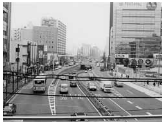
中目黒駅プラットホームより 山手通りを望む

以上計画概要について、 順次取り上げていく考えです。 本号では、品川線計画をこ紹 介いたします。