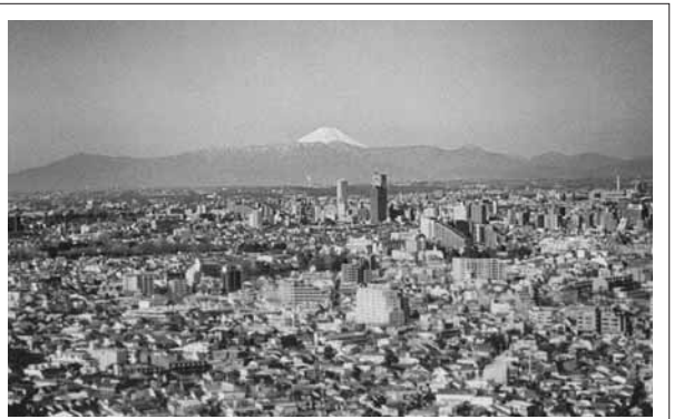
GT屋上から見える山並み (H16.3.8撮影)