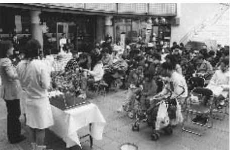
外国人も参加して馴れないながらもビンゴゲームを楽しんだ。