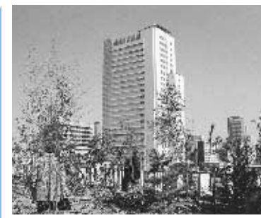
緑化された目黒区総合庁舎屋上からGTを臨む

去る三月二十六日、区庁舎の屋上緑化の再整備が完成し、見学させていただきました。緑化面積は、一、二二〇㎡。余、目黒野菜畑・新種屋上緑