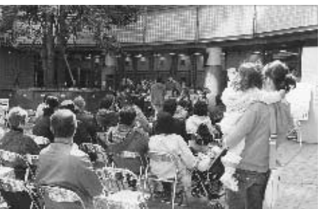
ジョナウインドオーケストラによる吹奏楽の演奏風景。規律正しい演奏は好評であった。

中目黒GTは、この春三周年を迎えました。これを記念してGTプラザ商店会では三月十九日から二十六日までの八日間、全店でサービス品を用意しセールを行いました。最終日の二十六日は、若い男女で編成された吹奏楽団「ジョナウインドオーケストラ」によりマーチやデイズ二ーなどのお馴染みの曲が演奏され