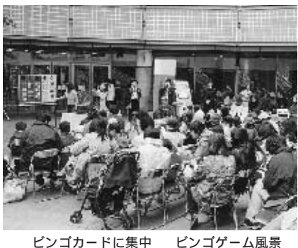
ビンゴカードに集中 ビンゴゲーム風景

曇り空でしたが、桜に誘われGT広場のサウンドステージは大勢の人で賑わいました。先陣は、地元目黒離子上目