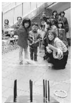
親子それぞれに輪投げを楽しむ

曇り空でしたが、桜に誘われGT広場のサウンドステージは大勢の人で賑わいました。先陣は、地元目黒離子上目