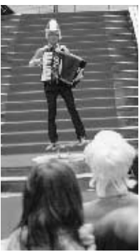
アコーディオンパフォーマンスショー 足もとに注目

CTによるブロードウェイミュージカルナンバーライブなど華やかなステージを繰り広げました。