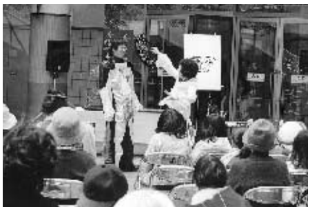
お客さんをモデルにおもしろおかしく話しながら似顔絵を描く

すっかりお馴染みになったビンゴゲーム大会に、子供連れの若いお母さんからお年寄りまで大勢が参加し大いに盛り上がりました。 輪投げ遊びに、似顔絵エントテイメントショー、パフォーマンスと多彩なプログラムに春の一日を楽しみました。