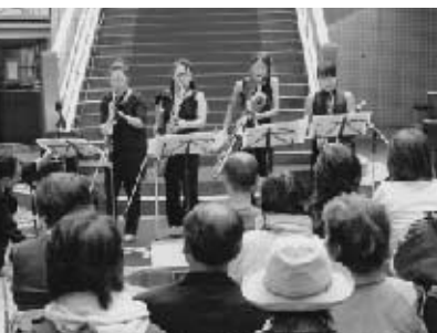
美しいハーモニーを奏でる サクソフォンカルテットの演奏