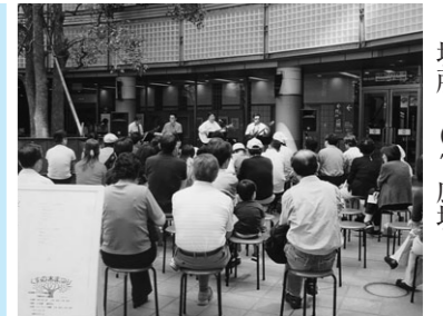
▲ 昨年のくすの木まつり風景・フォークを楽しむ