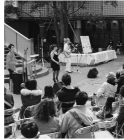
▲ 昨年のGT春まつり風景・フォークグループの演奏

最後は、お楽しみ「GTの日記念ビンゴゲーム大会」GT広場が、華やかに賑やかに皆様をお迎えします。どうぞ、お出かけください。