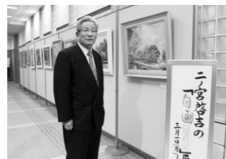
③ ニノ宮啓吉絵画展