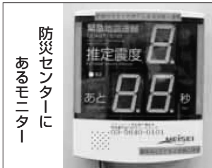
防災センターにあるモニター

中目黒GTでは、今年1月15日から、緊急地震速報システムを導入しました! ~♪チャランチャラン♪チャランチャラン♪ 「緊急地震速報!〇〇秒以内に大きな揺れが来ます」といった具合に気象庁と直結したシステムが連動して、震度4以上の地震発生を感知すると、事前に放送が流れる仕組みです。 速報が入っても“慌てず 落ち着いて 行動しましょう” まずは、『護身』その後の非常放送に従ってください。