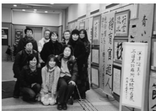
② 深津諭美子書道教室展