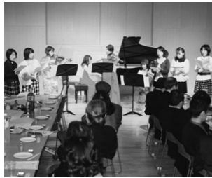
▲ニューイヤーコンサート