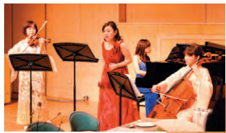
▲アマビレトリオによる演奏風景

一月十八日、午後三時からGTホールにおいて、GT賀詞交歓会が行われました。開会に先立ち、アマビレトリオによる演奏会が行われ、六十名以上の関係者の皆様が、楽しいひとときを過ごしました。