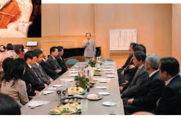
▼賀詞交歓会の様子