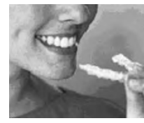
▲アライン社の歯科矯正装置

も地下の駐車場スペースを利用して始めました。会員登録や利用予約をパソコンや携帯で行い、ドアの開閉も携帯電話を使って行います。ガソリン満タン返しや保険料も必要なく、簡単・便利な合理的サービスとして普及が進んでいるようです。