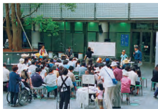
▲昨年のくすの木まつりの様子

GTのシンボル、くすの木に因んで毎年行われるGTプラザ商店会主催の「くすの木まつり」が、今年も左記の日程で開催されます。当日は、フォークソングや、恒例ビンゴゲーム、遊びコーナーなど、楽しい企画が沢山ありますのでお楽しみに。 日時 五月八日(日) 十三時～十六時 場所 GT広場 雨天の場合は中止となります。