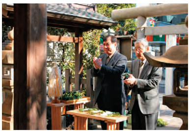
▲崇敬会の皆様による玉串奉天