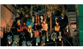
▲昨年のあかりまつり

十二月一日(木)から、GTライトアップイルミネーションがスタートします。中目黒あかりまつり2011も左記の日程で開催いたします。 ●中目黒あかりまつり2011 ライトアップ イルミネーション 十二月一日～一月九日 ●私のクリスマスツリー展 十二月十二日～二十五日 ●古代の行列 十二月十六日 ～二十五日 ●あかりまつり コンサート 十二月二十三日 ～二十三日 ●昨年のあかりまつり コンサート