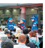
▲昨年のオータムの一コマ

十月十六日(日)十三時から十六時まで、GT広場においてGTプラザ商店会主催のオータムフェスティバルが行われます。今回はマジックのマジックアーティストや緑日出版、抽選会など楽しいイベントをたくさん用意しています。また、同日には中目黒商店街連合会主催の「ナカメオータムフェスタ」が開催されます。合流地広場での音楽祭や、フリーマーケットなどイベント盛りだくさんです。