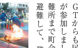
▲消火器の使用実地訓練