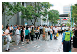
▲GTビル内から避難してきた皆さん

七月八日(金)午後二時から、GT全館避難訓練が行われました。GT各テナントの社員の皆様、店舗従業員の皆様、お住まいの皆様など七百五十名が階段を使って、タワー前広場に避難してきました。講評の後には、起震車体験、消火器実射、煙体験などが有り一部