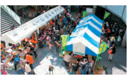
▲昨年の福祉の集い、バザーの様子

十月二十二日(土)に、GT敷地内を会場として、目黒区社会福祉協議会の主催による第八回めぐる地域福祉のついでが開催されます。当日はバザー、ステージでのイベントや、パサーなど一日中楽しめます。