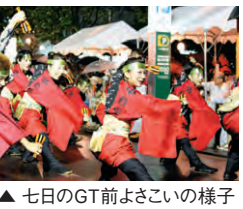
▲七日のGT前よさこいの様子