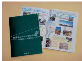
坂道ウォーキングのすすめ

秋は絶好のスポーツの季節、その中でも身近な運動と言えば、ウォーキングでしょうか。目黒区には、ウォーキングに適した道が沢山あります。また、目黒区は起伏に富んだ坂の多い街で、十三の名前の付いた坂道があります。今回はのんびり散歩に最適な軽い坂道を含んだ散策コースをご紹介します。三十四号で一度紹介しましたが、目黒区発行の「坂道ウォーキングのすすめ」から、今回のおすすめコースをご紹介します。ご家族でぜひ挑戦してみてくださいいかがでしょうか。