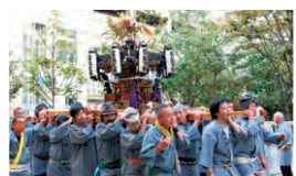
▲目黒通りの神輿風景

九月二十四日(土)、二十五日(日)、中目黒八幡神社例祭が行われました。小神輿山車・大神輿(二十五日)が目黒銀座通りを練り歩きGTでも接待を行いました。