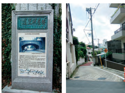
▲「茶屋坂隧道」モニュメント ▲細い急坂「茶屋坂」

目黒川の中里橋から恵比寿ガーデンプレイス方面に向かう坂が「新茶屋坂」。平成十一年まで、坂の途中に「茶屋坂隧道」というトンネルがあり、上には玉川上水から分水した三田用水がかつて流れていた。隧道は昭和五年に建設され、当時の土木技術の粋を集めて構築されたアーチ型橋梁で、(社)土木学会から「日本の近代土木遺産」に選定されていた。三田用水は江戸初期に作られた用水路で、飲料・農業等の他、大名屋敷の池の水源や幕府の火薬製造のための動力(水車)としても利用され、明治半ばになると、その良質な水を利用したビール