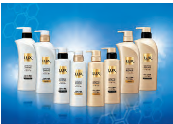
「ラックス スーパーリッチシャイン」 「ラックス スーパーダメージリペア」

2011年秋のおすすめは、美肌サイエンスを髪に応用した、新しい「ラックス」のシャンプー・コンディショナーシリーズです。パサついてまとまらない髪のための「ラックススーパーリッチシャイン」は、髪の奥までうるおいを満たし、想像以上のなめらかさへ。ひどく傷んだ髪のための「ラックススーパーダメージリペア」は、ダメージを集中補