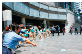
▲GT広場に水を撒いた一コマ

八月十一日(木)十二時から、GT地下の広場でGTスタッフ約三十名で、一斉に地面に水を撒く、打ち水作戦が行われました。地面温度が約二度下がりました。夏の節電の時期に有効な一コマでした。