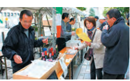
▲昨年のGT参加店舗風景

十月二十九日(土)、目黒区商店街連合会主催、のんびり散歩2011が行われます。中目黒から学芸大学コース、など8コースで参加店舗の商品試食をしながら散歩を楽しむ企画で参加無料。GT商店会からもお店します。詳しくは東急沿線情報「とくらく」検索