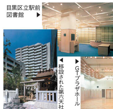
▶移設された築天神社

GTタワーは地上二十五階建ての制震構造の建物、GTハイツは十五階建ての免震構造、GTテラスは六階建ての耐震構造の建物で地震に対して最新の構造になっています。