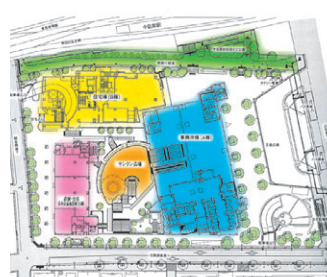
▲中目黒GT敷地内建物配置

平成九年十一月「上目黒二丁目地区市街地再開発組合」が設立され、平成十一年八月建物が着工され、平成十四年四月、中目黒GTがグランドオープンしました。