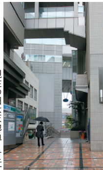
▶現在の旧六天地通り付近

この再開発における街づくりの目標は、魅力ある駅前環境づくりなど四つを上げており合わせて六つの地区整備方針に基づいて開発が進められることとなりました。