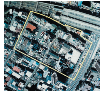
▲開発前の上目黒二丁目地区

中目黒は東急東横線・東京メトロ日比谷線の中目黒駅を中心として、山手通りにも面し、渋谷をはじめとして都心部から非常に近い環境にあります。しかし、昭和六十年目黒区策定の土地利用計画においては、店舗、事務所の過密化が著しく、総合的に整備する必要があります。また、中目黒駅前には位置する上目黒二丁目地区は木造家屋が密集し防災上も改善が必要でした。これらの地域環境を整備する必要があります。昭和六十三年、中目黒駅周辺地区整備構想・整備方針が示され「上目黒二丁目地区市街地再開発」事業の街づくりへと進んできました。