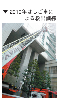
▲2010年はしご車による救出訓練

GTではオープンから毎年二回GT全館避難訓練を実施しています。GTで働く皆さん七百名近くが避難する大規模なものです。はしご車による救出や、起震車体験など火災をはじめ、地震災害など総合防災訓練として行っています。