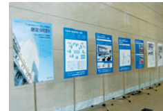
▲タワー棟ロビーのパネル展示 災害に関する取り組みを紹介するパネル展示を行いました。

GT内歩道の植栽替えしました GT内歩道の植栽を植替えました。二種類の植物ですが踏み込みによる被害を防ぐため