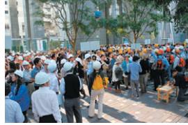
▲2006年タワー前広場に避難した従業員

GTではオープンから毎年二回GT全館避難訓練を実施しています。GTで働く皆さん七百名近くが避難する大規模なものです。はしご車による救出や、起震車体験など火災をはじめ、地震災害など総合防災訓練として行っています。