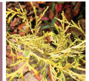
▲植栽の一つ「フィリフェラオーレア」

「中目の黒本」第三版発行 三月に、中目黒タウンガイド「中目の黒本」の第三版が発行されました。発行は「中目黒をさらに良くする連絡会」、第三版となり中目黒店舗情報満載です。定価は二百円、中目黒駅そばのブックセンターほか近隣書店などで販売しています。