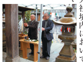
▲会員による玉串奉天の様子

一月二十八日(土)午後二時から、あいにくの冷たい雨の中、第六天社境内において一月例祭が、崇敬会の皆さんにより執り行われました。