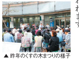
▲昨年のくすの木まつりの様子

五月二十日(日)午後二時からGTプラザ商店会主催の「くすの木まつり」がGT広場で行われます。当日は、パフォーマンスやライブ、ビンゴゲームなどが行われます。また、当日から一週間は、GTプラザ商店会フェア期間となります。