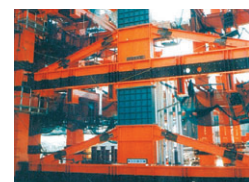
▲GTタワーの制震構造 耐震構造の建物で地震に対して最新の構造になっています。

GTタワーは地上二十五階建ての制震構造の建物、GTハイツは十五階建ての免震構造、GTテラスは六階建ての耐震構造の建物で地震に対して最新の構造になっています。