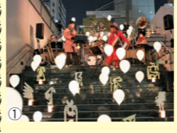
① 昨年の1シーン ② あかりまつりコンサート ③ イルミネーション ④ GINGAパレード

十一月一日(火)から、GTライトアップイルミネーションがスタートします。中目黒あかりまつり2013も左記の日程で開催いたします。 ●中目黒あかりまつり2013 ●ライトアップ ●イルミネーション 十一月一日～九月九日 ●古代の行列 十二月二十一日～二十四日 ●光りのイベント(展示) ●バルーンパレード ●GINGA ●あかりまつりパフォーマンス 十二月二十一日