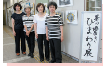
① 墨の響きひまわり展