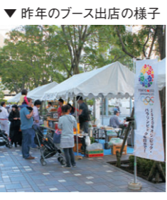
▼昨年のブース出店の様子

十月二十六日(土)十時から午後三時、GT一階広場内を会場として、目黒区社会福祉協議会主催による「第十回めぐろ地域福祉のひろば」が開催されます。イベントや、バザーなど一日中楽しめる催しです。