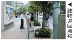
建物巡回点検という取組みです。組合理事の皆さんや管理スタッフによる建物巡回点検や、GT関係者による朝の清掃「ミニスイーパーズ」を行なうなど、GT全体が協力して実施しています。

GTでは、九月九日から十月九日まで、GT全体管理組合主催によるGT「クリーンアップ爽やかキャンペーン」を実施しています。これは、GTを綺麗で快適にしようと、建物周辺に取組みます。組合理事の皆さんや管理スタッフによる建物巡回点検や、GT関係者による朝の清掃「ミニスイーパーズ」を行なうなど、GT全体が協力して実施しています。昨年からは始まったこの取組みは継続的に進んでまいります。