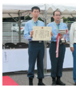
▲精鋭3名と小泉目黒消防署長 ▼GT隊の審査風景

において、平成二十五年目黒区自衛消防活動審査会が開かれました。GTからも自衛消防隊精鋭三名が参加し、日頃の訓練の成果を発揮、参加二十六チームの中で見事、最優秀賞の栄誉に輝きました。今後も安全・安心の為に精進してまいります。