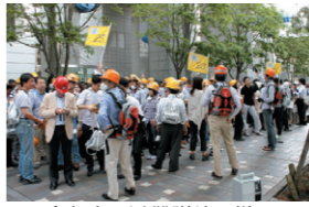
▲今年春の避難訓練の様子 お住まいの皆様は、いつもの時の備えとして参加していただくようお願い致します。

十一月七日(木)午後二時から、GT全館避難訓練を行いました。GT各テナント社員の皆様、店舗従業員の皆様、お住まいの皆様は、いつもの時の備えとして参加していただくようお願い致します。当日は、避難場所へ集合後、消火器やAEDの実体