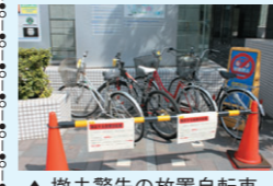
▲撤去警告の放置自転車

自乗車対策を行なっております。しかし、放置自転車の増加に伴い、今年四月から自乗車整理の体制を強化し、目黒区の放置自転車撤去活動の協力を得て、四月以降平均四台の撤去を実施しており、長時間の放置自転車は減少傾向となり効果が表れています。最近では取締