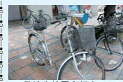
▲敷地内放置自転車 敷地内では以前から、自転車整理員を配置し、放置

中目黒GTでは、敷地内放置自転車対策を行なっております。中目黒駅周辺は、目黒区の「自転車放置禁止区域」になっており、中目黒GT敷地内の歩道も同様です。GT内では以前から、自転車整理員を配置し、放置