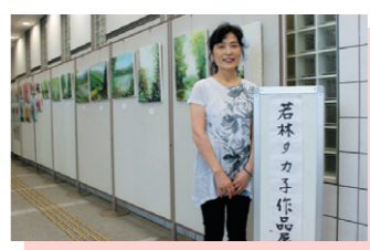
⑤ 若林タカ子作品展