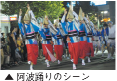
▲阿波踊りのシーン

九月二十四日(火)、十五時より、GT敷地内第六天社境内において中目黒八幡神社同部宮司の司式で、崇敬会の皆さんにより、九月例祭が執り行なわれました。十五日に予定されていたが、台風の影響でこの日になりました。