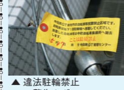
▲違法駐輪禁止の警告タグ