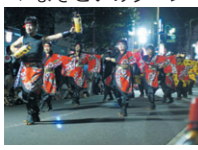
▼よさこいのシーン

こい、両日で総勢二千五百名が熱い踊りを披露しました。最後は各エリアに分かれお踊りまくる乱舞があり、最高潮の内に全ての祭りが終わりました。今年も夏の二日間にわたって中目黒が暑く燃えました。