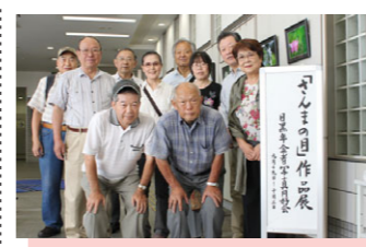
⑥ さんまの目写真展