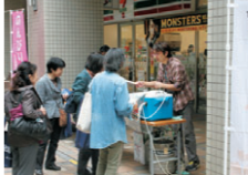
▲ 昨年ののんびり散歩

十月二十六日(土)、目黒区商店街連合会主催、「のんびり散歩2013」が行なわれます。 中目黒から学芸大学コースなど全八コースで参加店舗の商品試食をしながら散歩を楽しむ企画で参加無料。今回はGT商店会からの出店は有りませんが、是非参加してお楽しみ下さい。 詳しくは東急沿線情報「とくらく」HPへアクセス!