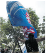
▲舞の旗手 舞の旗手 舞の旗手

八月三日(土)、四日(日)に、目黒銀座商店街、中目黒駅西銀座商店街主催の「第四十八回中目黒夏まつり」が開催されました。両日ともGT広場で、午後四時から各チームのデモンストレーションの舞いがあり、本番への意気込みが表れていました。天候にも恵まれた午後六時三十分から九時まで目銀通り、西