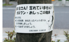
▲ GT歩道のおしっこ禁止札

GTの歩道植木の中に、犬の糞やおしっこの跡が見受けられます。 植木が枯れてしまっていますので飼い主の皆さんマナーを守ってご協力下さい。