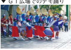
▼GT広場でのデモ踊り

こい、両日で総勢二千五百名が熱い踊りを披露しました。最後は各エリアに分かれお踊りまくる乱舞があり、最高潮の内に全ての祭りが終わりました。今年も夏の二日間にわたって中目黒が暑く燃えました。