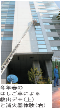
▲今年春のはしご車による救出デモ(上)と消火器体験(右)

験など、普段から身に付けて頂ければ、いざという時に必ず役に立つ体験もできます。日頃からの心構えとして、実体験して頂くようお願い致します。